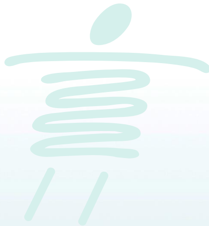
Médecin traitant (Tampon)